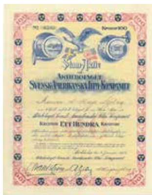
Objekt nr: 44, 1350:-